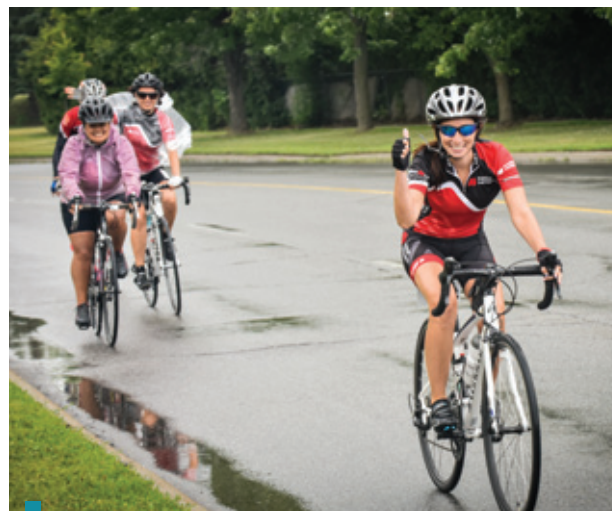
Les participants du 6 e Tour cycliste Présents pour les jeunes ont bravé la pluie pour une bonne cause!