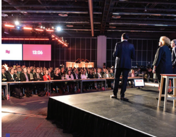
La Banque organise chaque année différents types de rencontres entre les employés et les membres de la direction pour traiter des priorités d'affaires.

Différents sondages réalisés périodiquement et de façon confidentielle nous permettent d'être à l'écoute des employés et des gestionnaires, de favoriser le dialogue avec ceux-ci et d'obtenir leurs suggestions, préoccupations ou commentaires quant aux différentes facettes de leur vie au travail. Cette rétroaction nous permet d'améliorer en continu les façons de faire de l'organisation et de faire vivre aux membres de notre équipe une expérience employé supérieure afin d'assurer un service client tapis rouge de même que la réussite de notre vision un client, une banque .